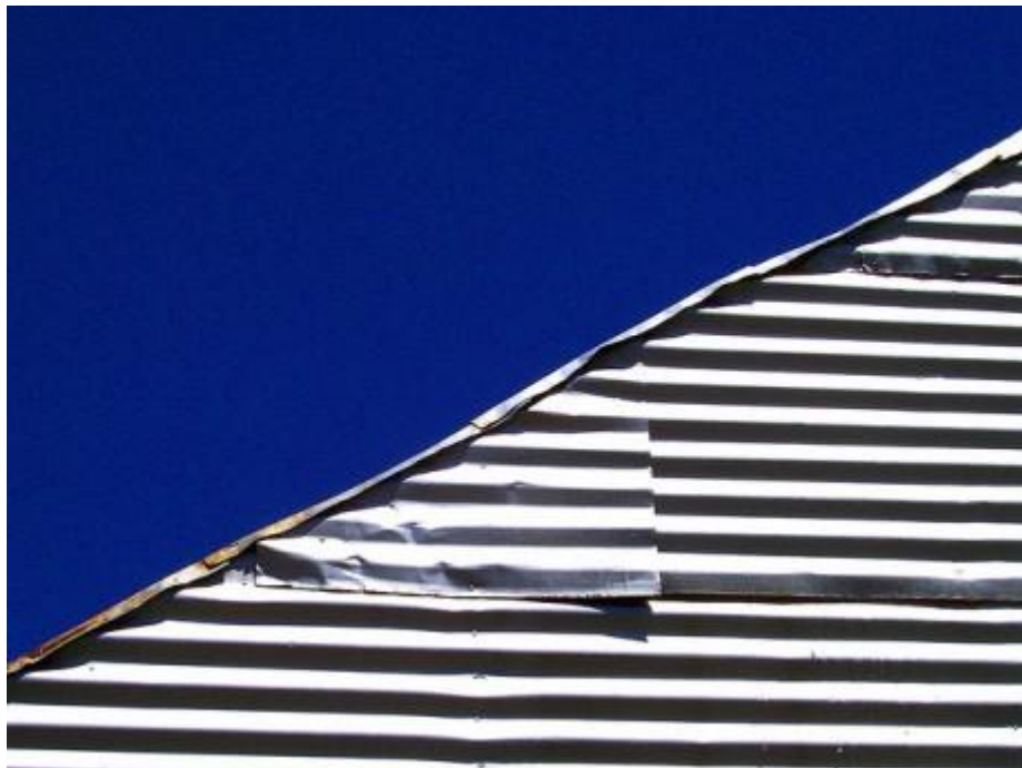
y=mx+b av Shawn Econo CC (by nc sa)

Det första steget när du ska skapa en webbplats är att ha en idé. Du behöver ha en tanke om vad du vill göra med din sida.