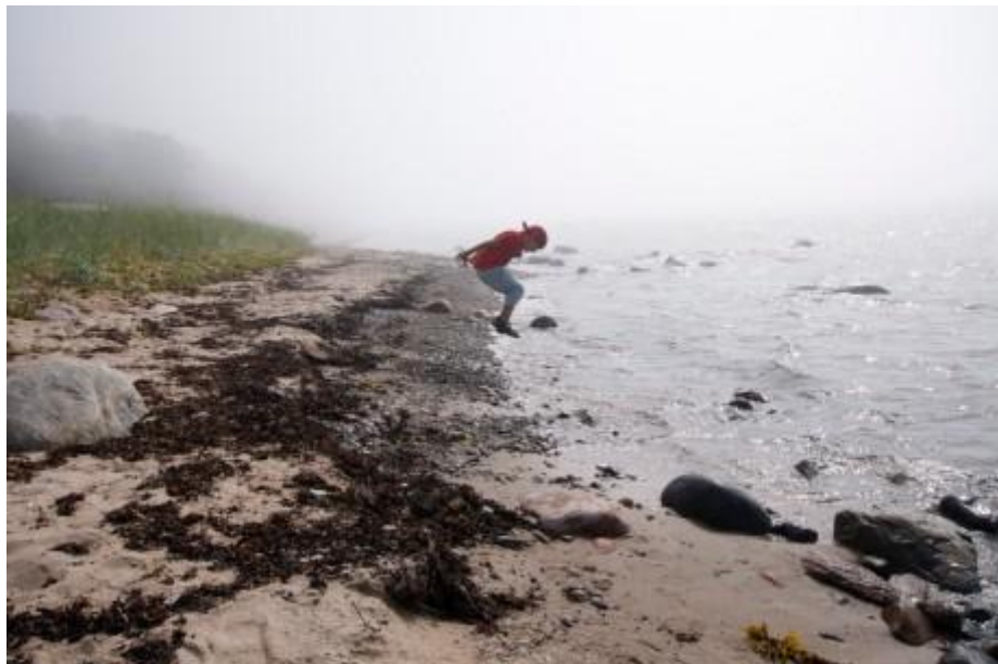
A jumping

Innan du börjar arbeta med din webbplats är det bra att fundera på hur du vill att den ska se ut, vilka funktioner ska finnas och hur ska besökaren ta emot informationen.